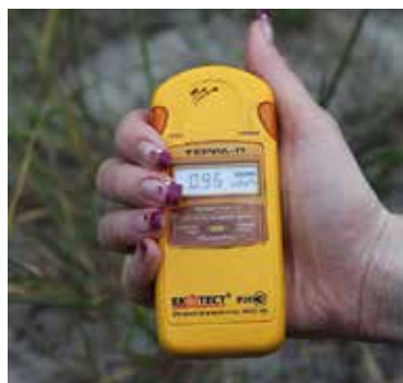
Figur 6: Dosimeter för stråldos i enheten sievert

intet, men ICRP:s inflytande var ändå stort i den bemärkelse att man förespråkade låga, accepterade stråldoser när det gällde exponeringen av stora befolkningsgrupper och nationer. Den största osäkerheten rådde när det gällde långtidspåverkan av förhöjd exponering. I grund och botten låg en avvägning mellan risk och nytta, som i strikt mening inte var vetenskaplig, men där vetenskapen kunde bidra med så mycket kunskap den kunde. Generellt var trenden mot allt mindre tillåtna doser.