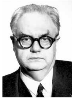
Figur 7: Sievert mot slutet av sin bana.

Det sägs att en av de största hedersbetygelserna som kan vederfaras en vetenskapare är att få en enhet uppkallad efter sig. Enheten för stråldosekvivalenten i SI-systemet fick 1979 namnet sievert. Därmed kommer hans namn att leva vidare som en del av vetenskapen.