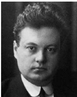
Figur 1: Rolf Maximilian Sievert

Få vet vem Rolf Sievert var, men nästan alla nickar igenkännande om man säger mikrosievert eller millisievert. Blir man en SI-enhet blir man i princip odödliggjord, men kanske på bekostnad av att personen man en gång varit försvinner i bakgrunden. Googlar man Sievert är det enheten som beskrivs, stråldosekviva-