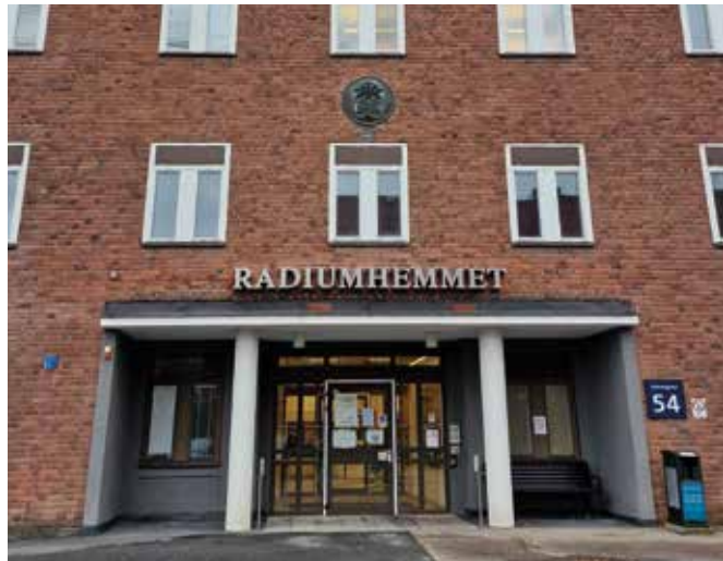
Figur 5: Radiumhemmet i Solna.

men inte så hårt att han inte gick i gång med nya projekt efter en stund. Hans största bekymmer var att det blev allt svårare att hitta finansiering till nya idéer.