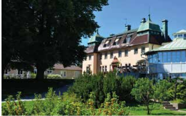
Figur 2: Såstaholm, familjen Sieverts herrgård vid Vallentunasjön