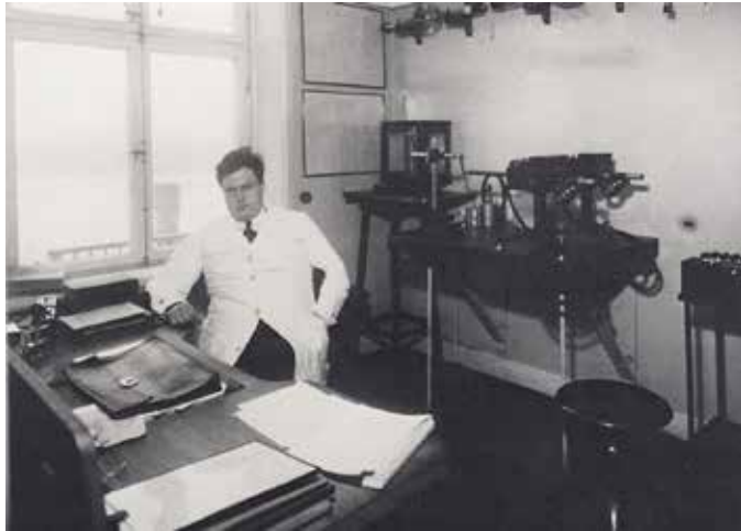
Figur 3: Sievert i sitt arbetsrum på Radiumhemmet 1925

Arbetet på det fysikaliska laboratoriet följde huvudsakligen tre utvecklingslinjer i perioden fram till andra världskrigets utbrott. Den första utvecklingslinjen var arbetet med att fastställa metoder för strålbehandling med röntgenapparater och radiumpreparat. Dokumentation av alla vid Radiumhemmet förekommande röntgenapparater och radiumpreparat var huvuduppgiften. Den andra utvecklingslinjen var att få bättre teoretisk kunskap om strålningens kvantitativa natur för att utveckla bättre mätinstrument, samt att bättre förstå strålningens biologiska verkan. Den tredje utvecklingslinjen påminde om den första men var externt fokuserad, alltså att vid landets sjukhus och privatklinikerna få samma standard vad gällde strålbehandling och strålsäkerhet.