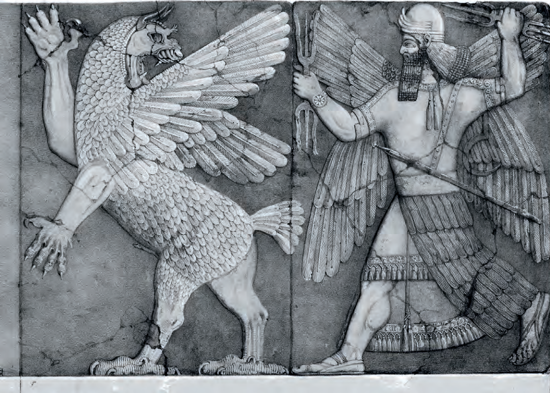
Artikeln's vinjettbild i sin helhet.